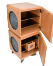
Oblù Design: Analogia Project