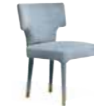
6659/1 MARTINICA - cm. 52x59,5x82 h. 6659/W MARTINICA - cm. 52x59,5x82 h. - h. seduta cm.48 Design: Dainelli Studio

Round dining table with Lazy Susan. Base in solid oak wood with dark bronzed brass, hand brushed. Lazy Susan in dark bronzed brass, hand brushed. Fin. black coal, open pore.