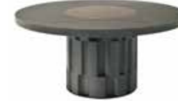
6660 ATMOS - Ø cm. 165x75 h. - Lazy Susan Ø cm. 70 Design: Dainelli Studio

Boiserie and bookcase. Fin. matt grey downpipe lacquered.