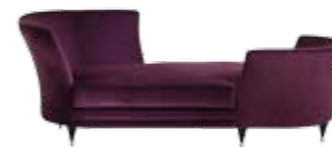
6503 TRICLINIA - cm. 225x100x85 h. - h. seduta cm.51

Floor lamp with central column in solid wood. Cylindrical velvet shade, inner part in satin gold or white. Satin brass base.