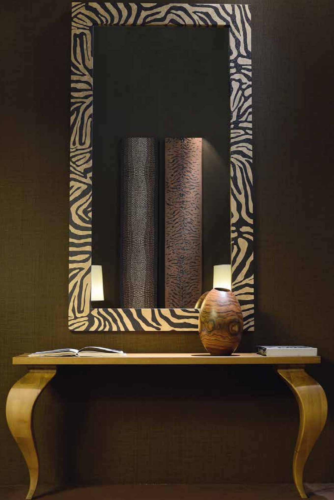
AM Design: Aldo Cibic