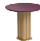
Flo Design: Lorenza Bozzoli