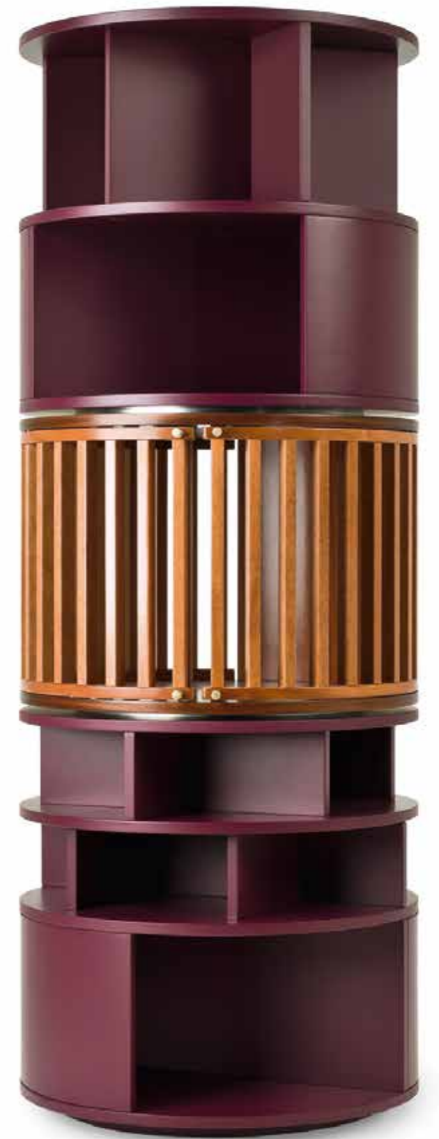
Babel Design: Storgemilano