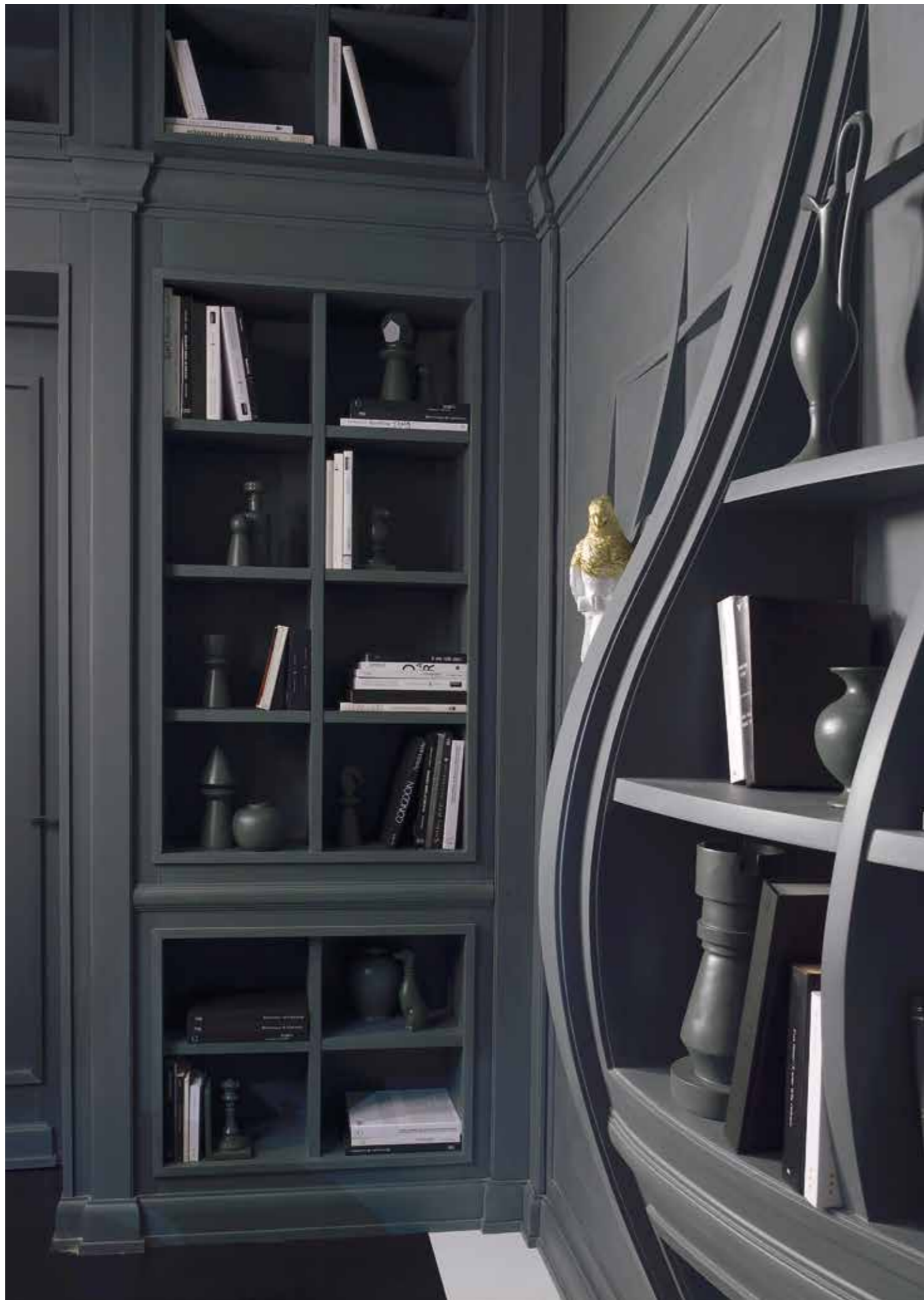
Blow libreria Design: Analogia Project