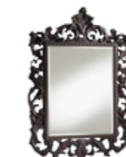
6532/G CLASSICLESS - cm. 130x185 h. 6532/P CLASSICLESS - cm. 103x150 h.

Upholstered armchair in pentagonal shape. Structure in solid wood. Available in every finish.