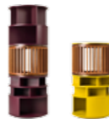
7139 BABEL - Ø cm70x187 h. 7140 BABEL - Ø cm70x124 h. Design: Stagemilano

7145 Closet 7146 Bar 1 7147 Bar 2 7148 Work station