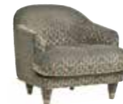
6526 CENTURY/CLUB - cm. 80x85x74 h. - h. seduta cm.50 Design: Dainelli Studio

Small chair with upholstered seat. Tips on legs in dark burnished brass, hand brushed. Fin. Shiny black.