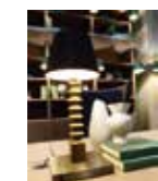
4322 LUCKY MOON - cm. 22,5x22,5x49 h.

Executive writing desk. Rectangular top with leather. Column in solid wood covered with leather. Satin brass details. Finish brown tre fiamme.