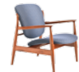
6529 CARLA - cm. 78x70x79 h. - h. seduta cm.37

Cocktail table. Structure completely covered in leather. Square top with geometric decoration composed by inlays in grey and prussian blue colour. Satin brass tips.