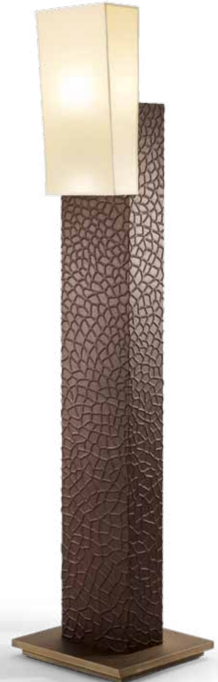
THEBA FLOOR Design: Lorenza Bozzoli