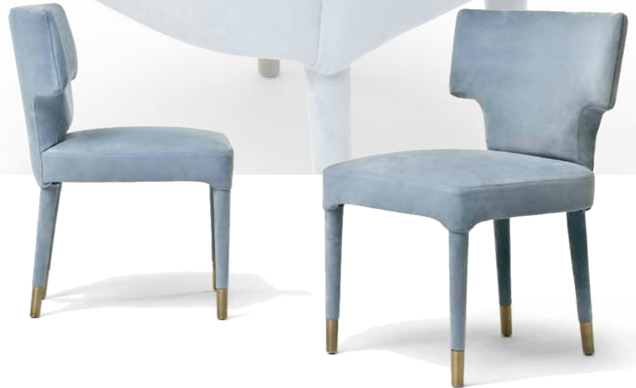
Martinica Design: Dainelli Studio