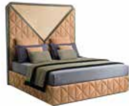
6657 CREEK - cm. 200x200x200 h. Design: ARXX Studio

Upholstered sofa. Capitonné seat and inside back. Outside back and sides plain. Base in solid ash wood. Fin. black coal, open pore.