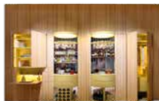
SURPRISE! - cm 245 h. Design: Lorenza Bozzoli

Chair. Upholstered seat. Tips in dark burnished brass hand brushed h cm.10. Finish 386 natural 10 gloss.