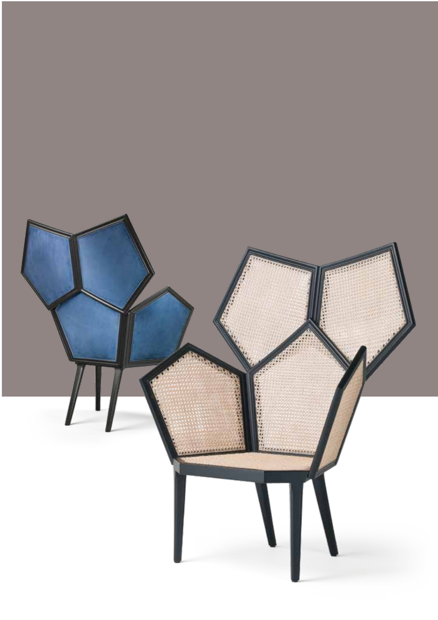
Lui 5/A Design: Philippe Bestenheider