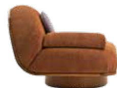
Thumb Design: Lorenza Bozzoli