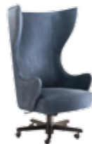
Ida/P Design: Fratelli Boffi