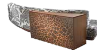
7166 WILD BACK - cm 300x83x78 h. - h seduta/seat cm 38 - mobile/cabinet cm 120x41x72 h. Design: Lorenza Bozzoli

Sofa with a low table with giraffe-striped inlay. Structure: mahogany plywood. Finish 397 giraffe.