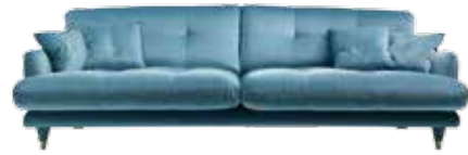
6525/A CENTURY/SOFA - cm. 277x105x85h. - h. seduta cm.50