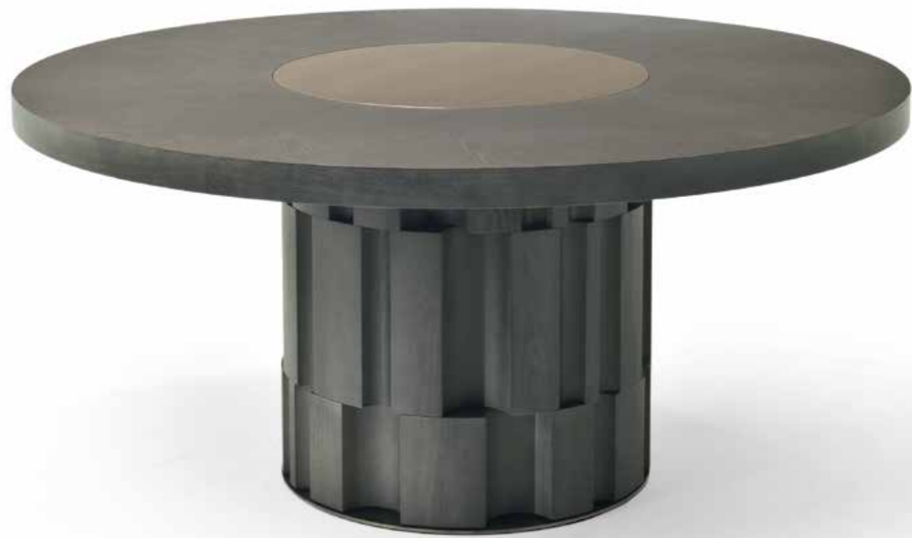
Atmos Design: Dainelli Studio