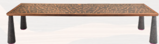
MASAI Design: Lorenza Bozzoli