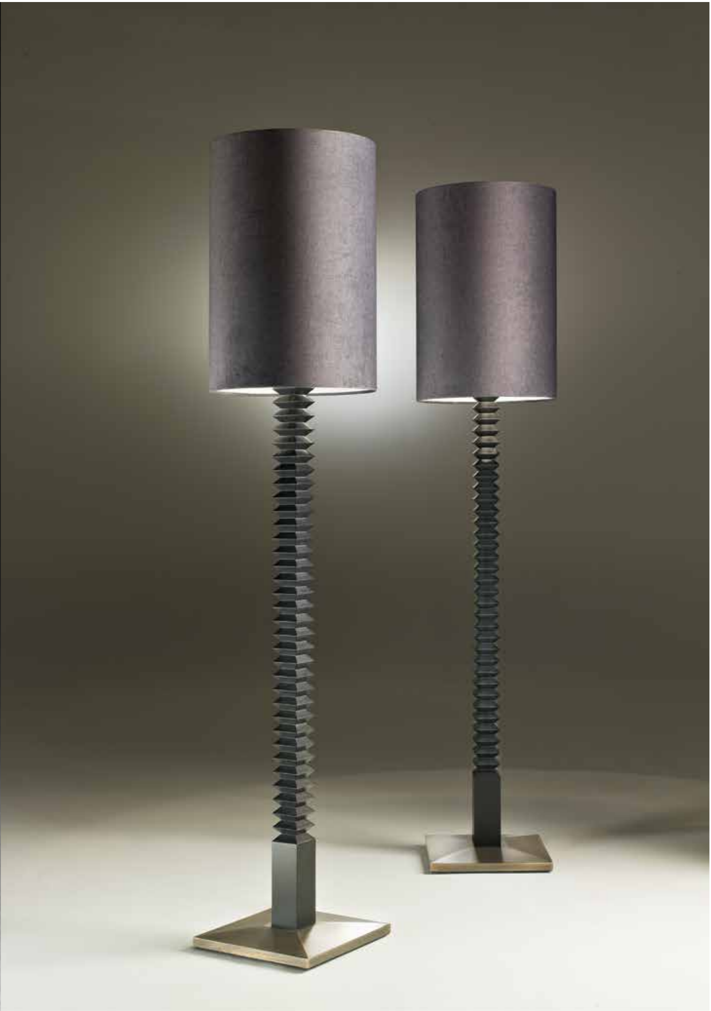
Lucky Star Design: Fratelli Boffi