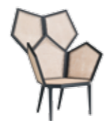
5610/C LUI 5/A - cm 103x72x123 h. - h. seduta cm.40