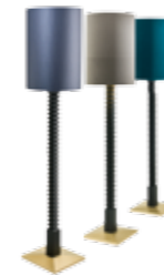
4310/CI LUCKY STAR - cm. 43x201 h. - (base - cm. 35,5x35,5)

Office armchair high back, fully upholstered. Upholstery with leather or fabric. Five star base fully rotating and adjustable height. Brown tre fiamme finish on base.