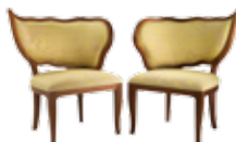
7131 CIUFFO SX 7132 CIUFFO DX - cm 74X62X90 h. - h seduta/seat cm 45

Console. Structure in solid walnut wood. Finitura 332 solid walnut.