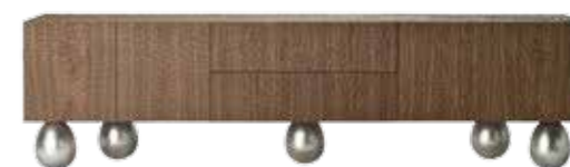
KENIA Design: Lorenza Bozzoli