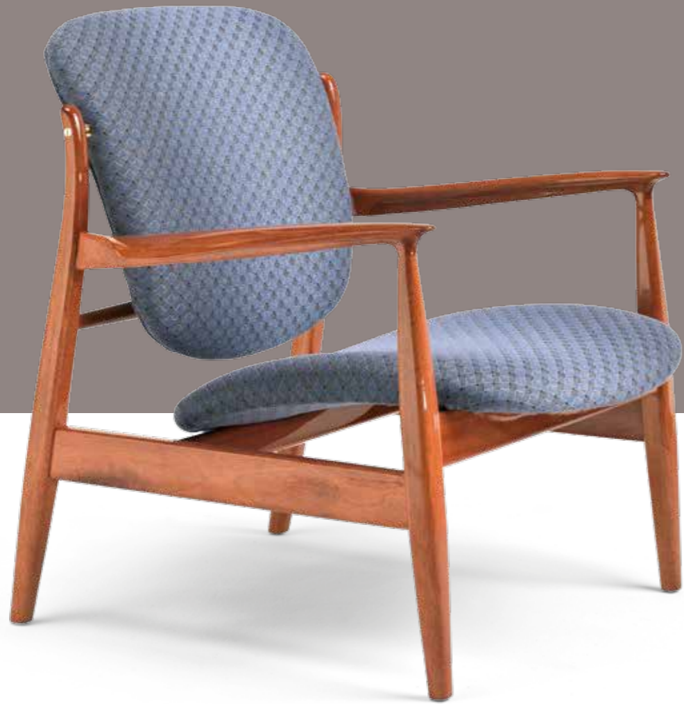
Carla Design: Fratelli Boffi