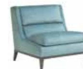
6655 OVERSEAS - cm. 82x87,5x78 h. - h. seduta cm.45,5 Design: Dainelli Studio