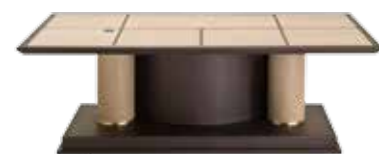
6533 ARCADE - cm. 220x115x74 h.

Small table with round top and central turned column. Engraved decoration "camperos boot" on legs. Solid mahogany structure.