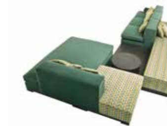
6652 TEQUILA - cm. 550x230+50x76 h. - h. seduta cm.46 Design: Dainelli Studio