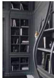
6508 BLOW LIBRERIA Design: Analogia Project

69-70 Libreria e boiserie in legno. Finitura: laccato grigio opaco Down pipe.