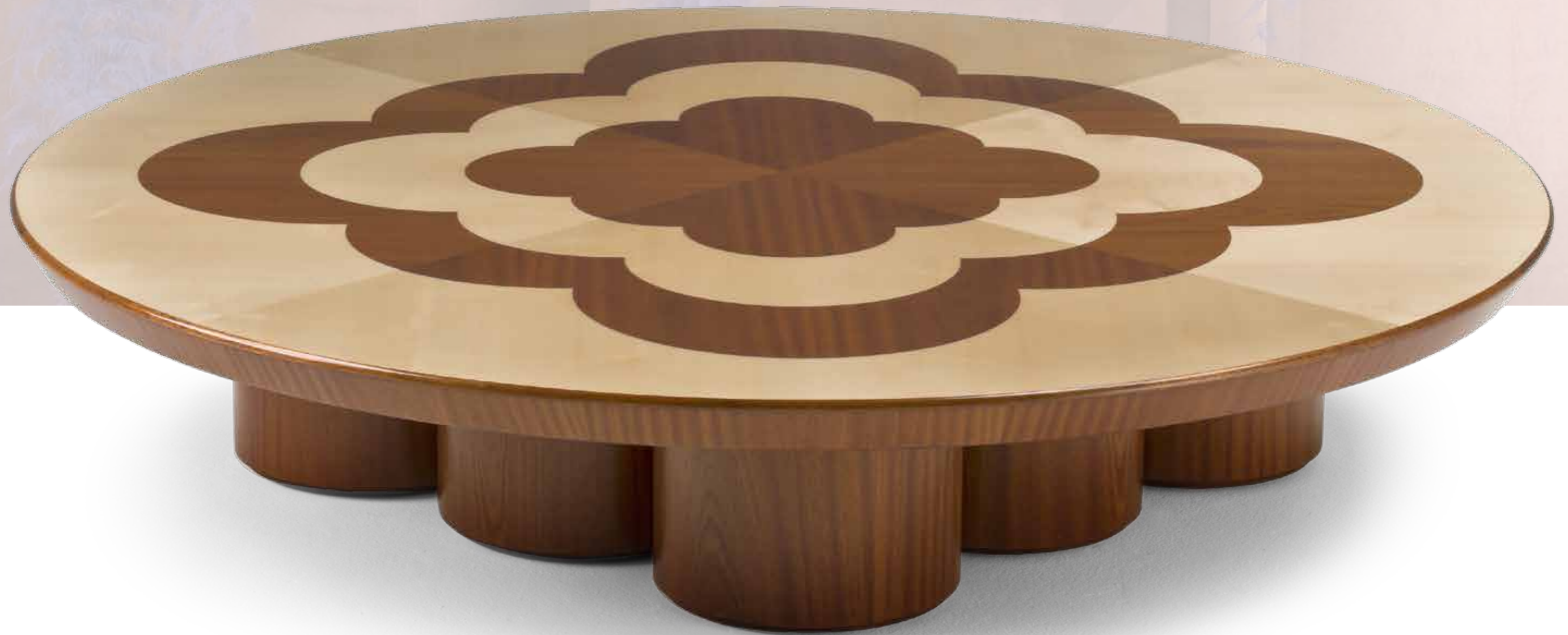
Archway CT Design: Cristián Mohaded