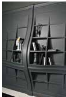
6507 BLOW BOISERIE Design: Analogia Project

Curved bench with buttoned back, fully upholstered also on the back. Structure in solid wood. Fin. Shiny black.