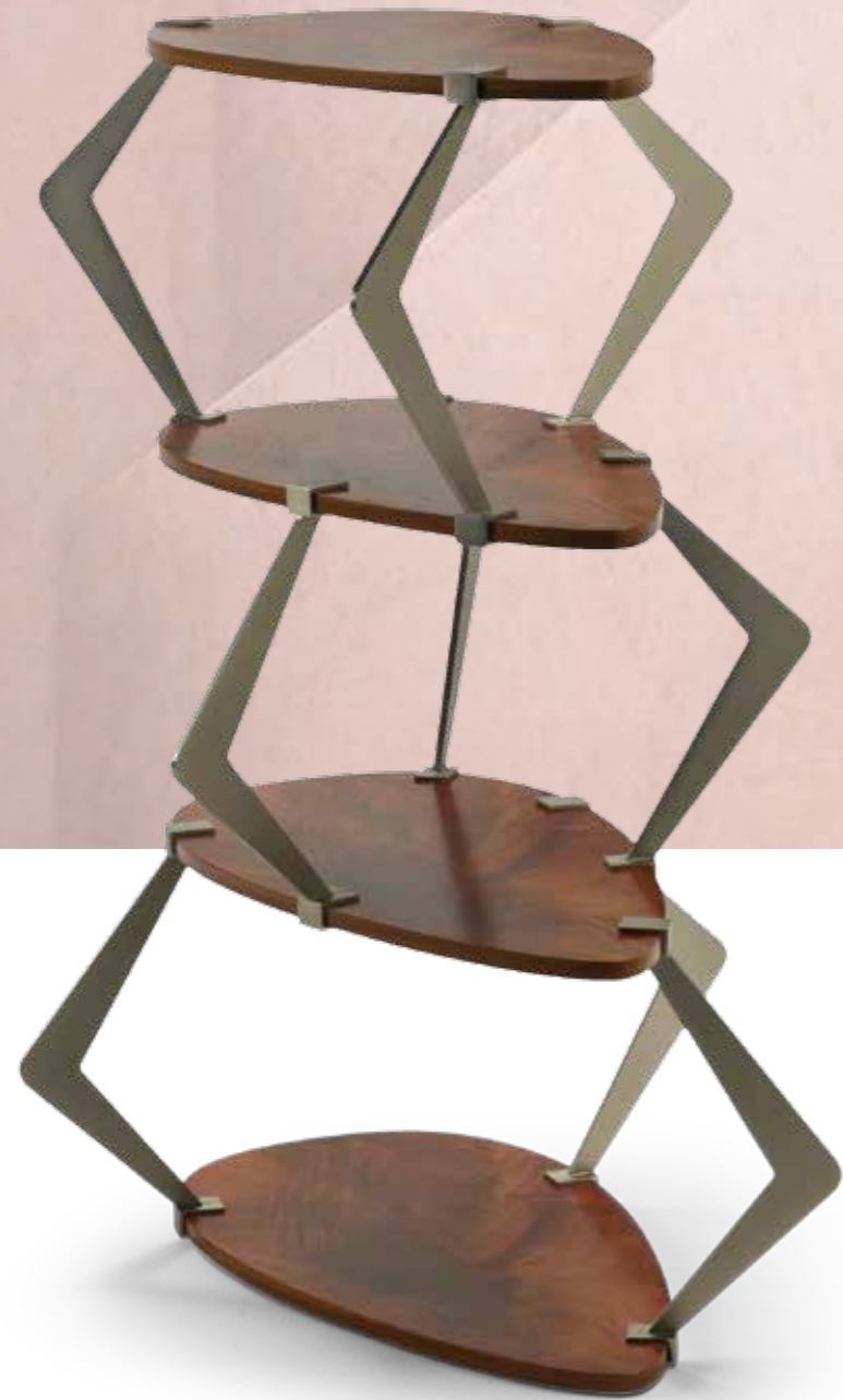
Étagère Swing Design: Roberto Serio