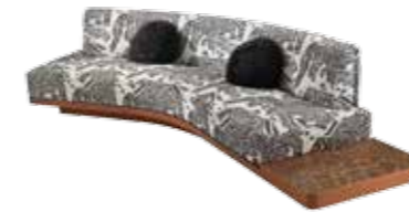
7167 WILD SIDE - cm 347x135x78 h. - h seduta/seat cm 38 Design: Lorenza Bozzoli

Low cabinet. Tortoise shell effect. Finish 398 tortoise dark walnut. Legs (n°5): egg shaped. Finish 327 bronze.