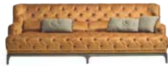
6656 KINGMAN - cm. 246x90x88 h. - h. seduta cm.44 Design: Dainelli Studio

Floor lamp. Cylindrical shade, inside matt silver col. Base in dark bronzed brass, hand brushed. Fin. black coal, open pore.