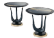
6534 SW6 - cm 51x58x90 h. - h. seduta cm.47 Design: Green Town Project

100 Tavolo lampada. Gambe in legno massello con finali in ottone satinato. Base in ottone satinato. Piano rotondo con marmo Explosion Blu o in legno.