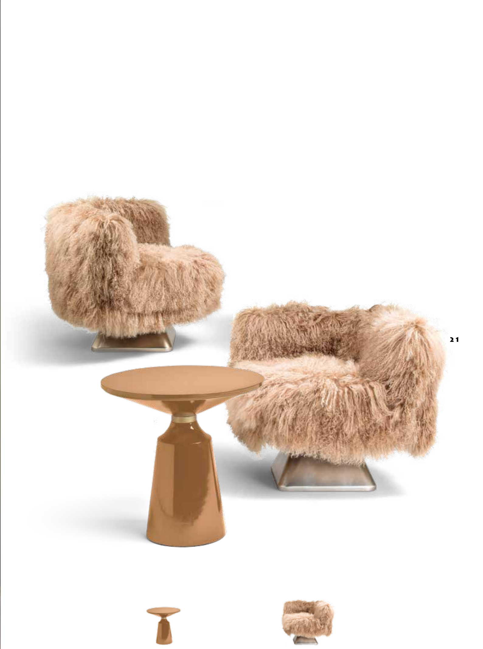
MERCER Design: Archer Humphries Architects