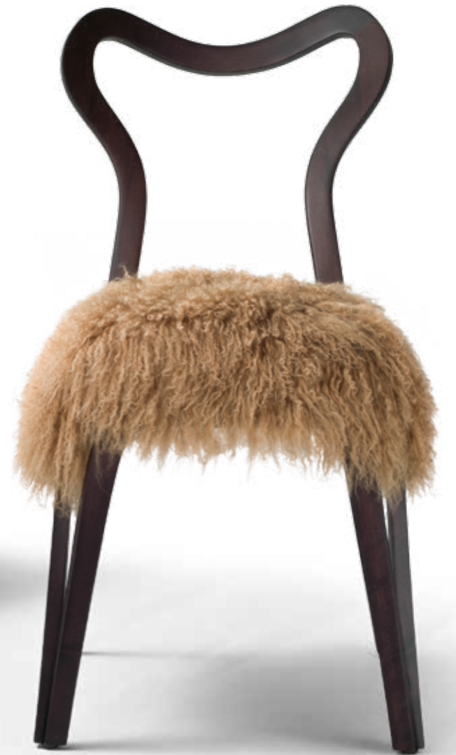
DAINA Design: Nigel Coates