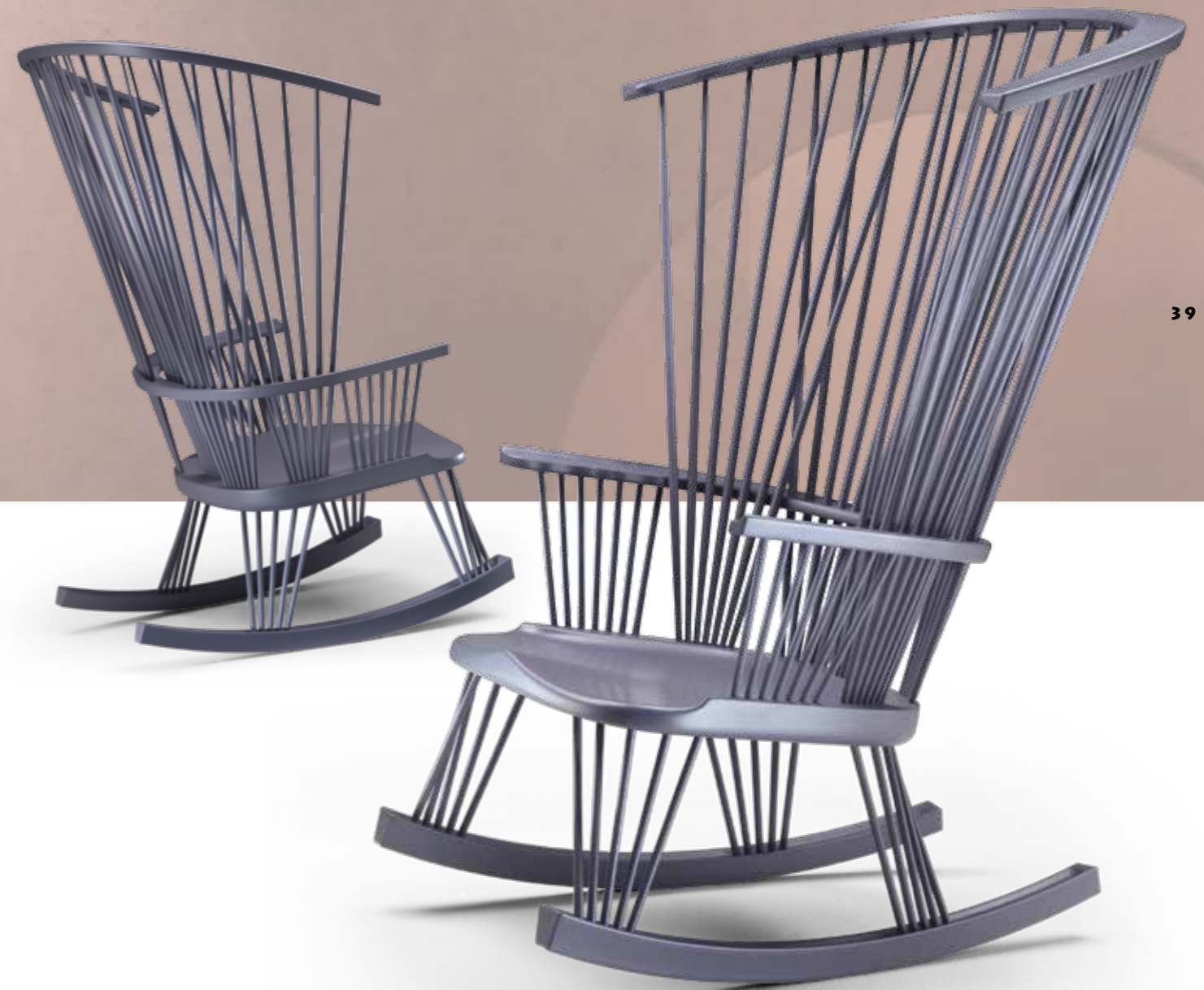
Sitlali Design: Philippe Bestenheider