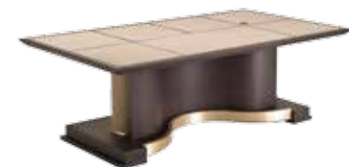
Arcade Design: Aldo Cibic