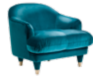
6526 CENTURY/CLUB - cm. 80x85x74 h. - h. seduta cm.50

Fully upholstered sofa with decorative cushions. Legs covered in fabric with satin brass tips.