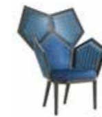
5610/I LUI 5/A - cm 103x72x123 h. - h. seduta cm.47

Caned armchair in pentagonal shape. Structure in solid wood. Available in every finish.